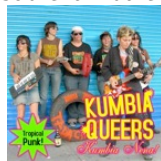
Portada del álbum Kumbia Nena! , 2007.

La nueva variación se llama Cumbia Villera o Cumbia de Barrio y es una reacción a la cumbia romántica. La música no habla de amor, sino que cuenta historias sobre la vida en los barrios: violencia, problemas con la policía, alcohol, drogas y sexo. 7