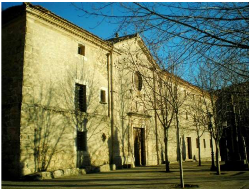
Fig. 22. Convento de San Miguel de las Victorias, Priego (Cuenca) 46 .

No se sabe si Vicente Comas había hecho presente sus intenciones al clero turolense en alguna ocasión; en cualquier caso, sobre la reacción que esta noticia tuvo al interno del capítulo, se sabe que el cabildo se mostró de acuerdo en buscar a un sustituto a quien se le destinaría la renta del beneficio, y el Deán sería el encargado de elegirlo. Un mes más tarde, el 3 de noviembre de 1856 47 , se leyeron las cartas de aceptación de Vicente Comas y del rector del colegio de Priego, acerca del sustituto.