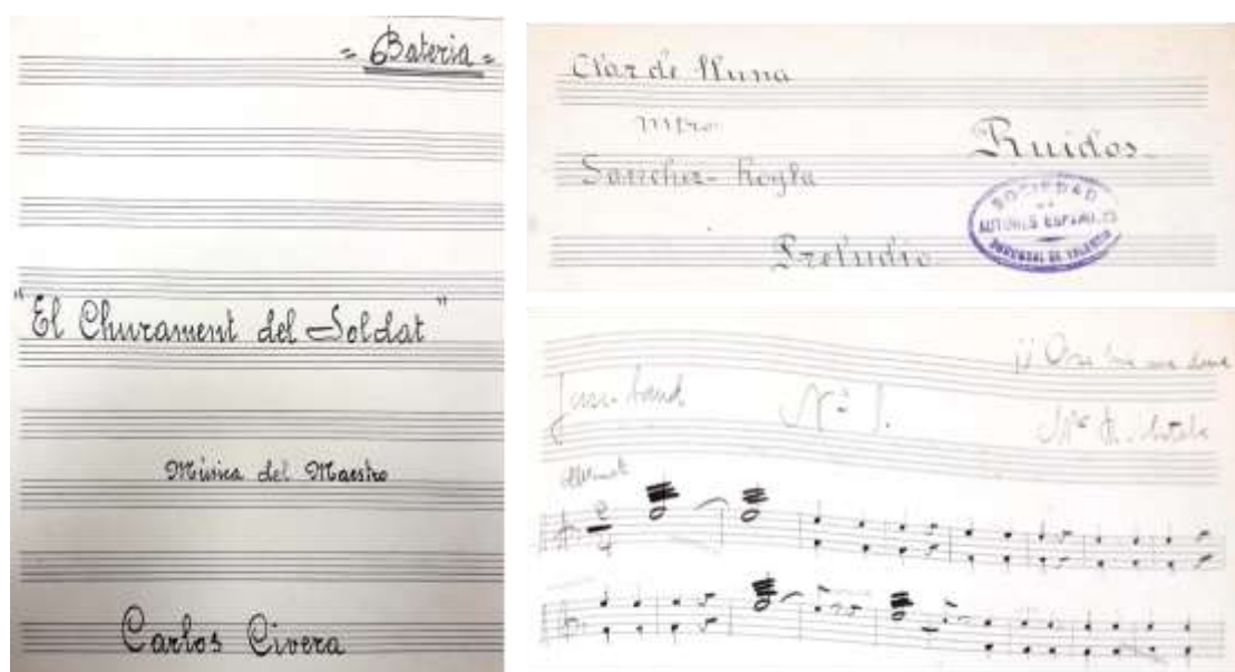
Figura 7. Partes de batería de los esquets valencianos: El churament del soldat , de Carlos Civera (1927), Clar de lluna de Juan Sánchez Roglá (1926) y ¡Así hía una donal! , de Roberto Sotela (1927)

Además, el Teatro Regional contaba con una orquesta compuesta por siete u ocho músicos profesionales, profesores de la Sociedad de Músicos de Valencia (Gayano, 1926: 14). Entre los instrumentos que formaban dicha orquesta se encontraba el jazz-band –nombre con el que se referían a la batería en la época–, cuyo origen está íntimamente relacionado con el jazz, y que se utiliza en la mayoría de los esquets que se estrenaron en el Regional.