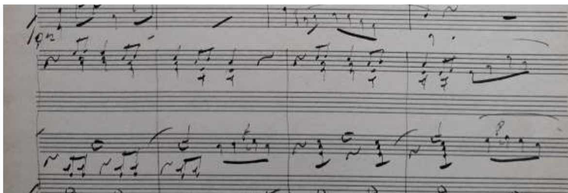
Figura 5. Tiempo de fox-trot del esquet valenciano Chagants y manos de Miguel Asensi (1926)